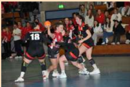
Frauen 1 -Landesliga