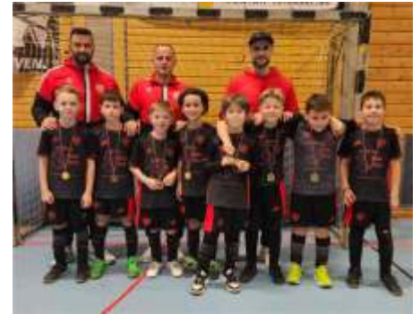
E-Junioren beim Turnier des FV Ay